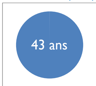
Figure 1 : Âge moyen