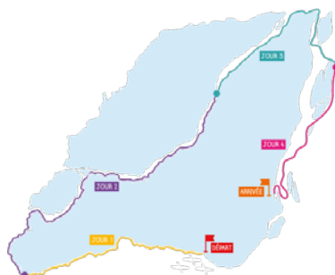
Figure 4 : Parcours